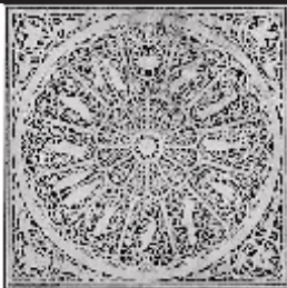
Zodiacen i kirken i San Miniato