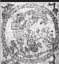
Fra katedralen i Otranto – en bonde, som høster i løvens måned.

Ønsker man å vite mer om Christa Hensels arbeid, har hun en hjemmeside med adresse: http://www.christa-hensel.com/